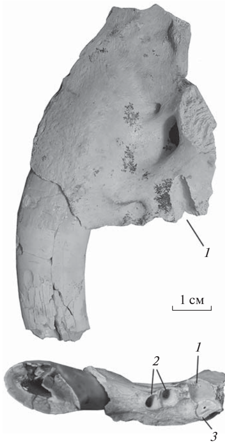
Рис. 2. Megantereon sp., экз. ПИН, № 5644/60, фрагмент верхнечелюстной кости с С1 и альвеолами Р3 и частично сохранившейся альвеолой Р4, вид с латеральной (вверху) и вентральной (внизу) стороны; нижний плейстоцен, пещера Таврида, Крым, Россия. Обозначения: 1 – альвеола корня парастилия; 2 – альвеолы Р3; 3 – корень протокона.

ской вырезки) составляет 47% длины Р4. Корень под параконем небольшой и примерно равен корню под протоконом (как и на образцах из других регионов). Корень под протоконом уплощен лабиолингвально. На экз. КФУ, № 10-145 этот корень почти на всем своем протяжении слит с корнем парастилия и только самый его конец является свободным. М1 располагался на костном гребне, образующим постеролабиальный край твердого нёба, и был высоко приподнят над его поверхностью. Судя по альвеоле, зуб имел один корень.