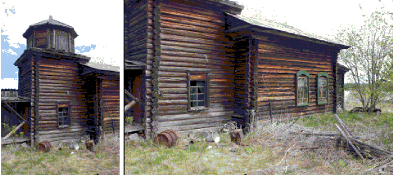
Рис. 1. Часовня на кордоне Комса: слева – колокольня, справа – основное строение, за которым видна алтарная часть

жизни каждого дерева. Эти особенности ДКХ широко используются в экологических исследованиях [11, 12], а также для датировки деревянных археологических и исторических объектов [13. С. 43–57; 14. С. 67–76; 15. С. 390–393].