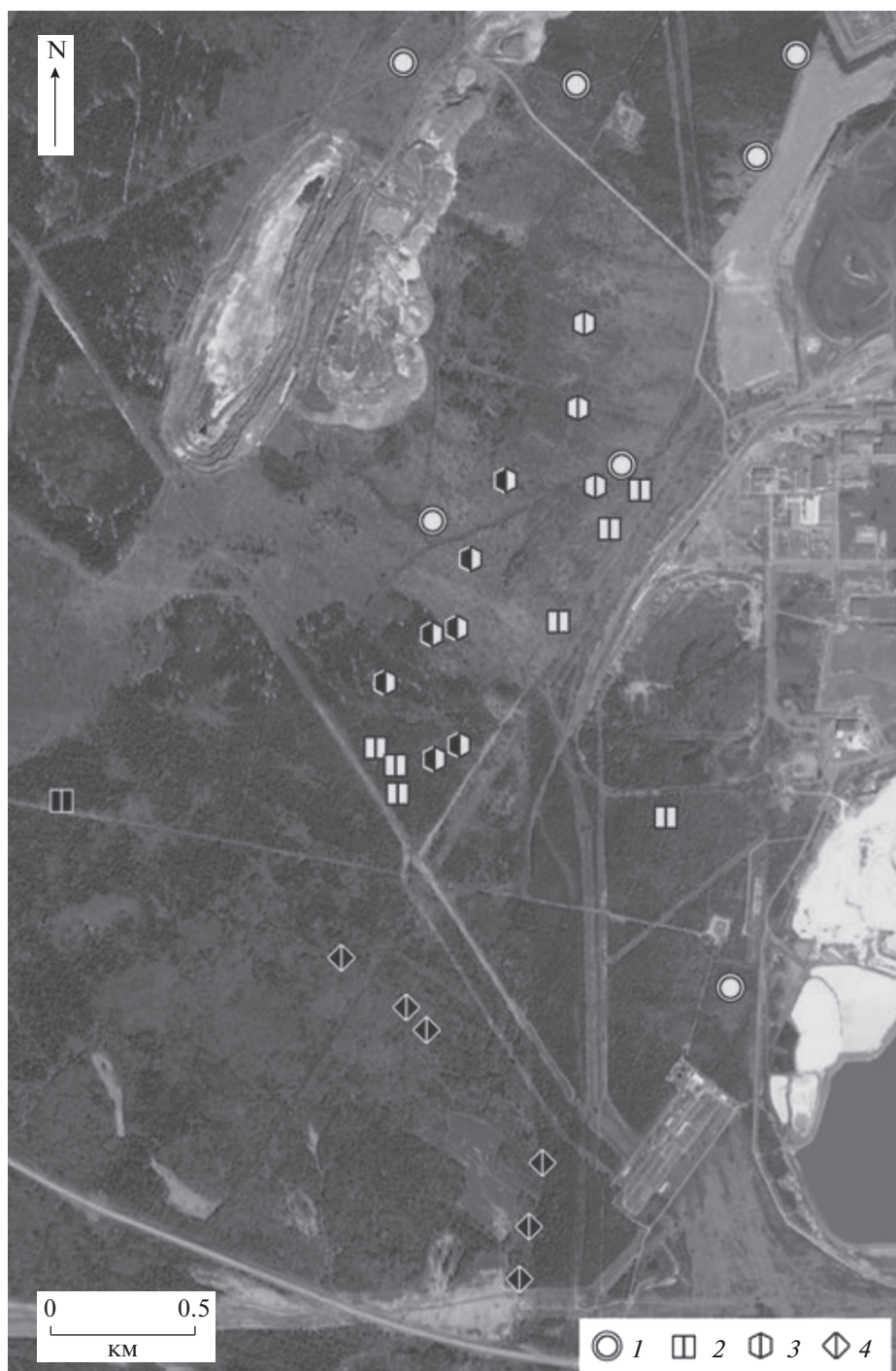
Рис. 2. Встречаемость дождевых червей и моллюсков вблизи пролегания современной границы “любрицидной пустыни”. Положение участка в масштабе импактного региона показано на рис. 1. Маркеры: 1 – временные пробные площади (ПП), на которых оценено обилие дождевых червей (соответствуют точкам на рис. 1), 2 – постоянные ПП для учетов почвенной мезофауны; 3 – валежные стволы, в которых выполнены количественные учеты беспозвоночных; 4 – валежные стволы, в которых выполнены качественные сборы беспозвоночных. Заливка маркера: наличие (черная) или отсутствие (белая) дождевых червей (левая половина) и наземных моллюсков (правая половина). Схема построена на основе спутникового снимка из Google Earth.

отсутствия тотального заселения муравьями хотя бы на участке длиной не менее 2 м.