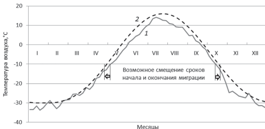
Рис. 4. Среднеголетняя сезонная динамика зарегистрированных и прогнозируемых температур воздуха на Таймыре.

1 — средняя за 1984–2004 г. температура воздуха по данным метеонаблюдений; 2 — температура воздуха по прогнозу к 2050 г. [20]