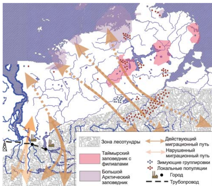
Рис. 1. Пути сезонных миграций дикого северного оленя на полуострове Таймыр. Для зимующих группировок и локальных популяций один кружок соответствует примерно 1000 особей Fig. 1. Seasonal migration routes of wild reindeer in the Taimyr Peninsula. For wintering groups and local populations a circle signifies approximately 1000 individuals

Целями нашей работы было выяснение по результатам многолетних полевых работ того, являются ли климатические изменения фактором, влияющим на миграции дикого северного оленя на Восточном Таймыре, и обоснование предварительных природоохранных мер, необходимых ввиду региональных климатических изменений и грядущей эскалации освоения территории.