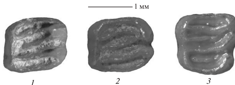
Рис. 2. Зубы Dryomys nitedula из отложений Игнatieвской пещеры. 1 — M2 sin (глубина 3,45–3,55 м), 2 — M2 sin (глубина 3,65–3,75 м); 3 — m2 dex (глубина 3,65–3,75 м).