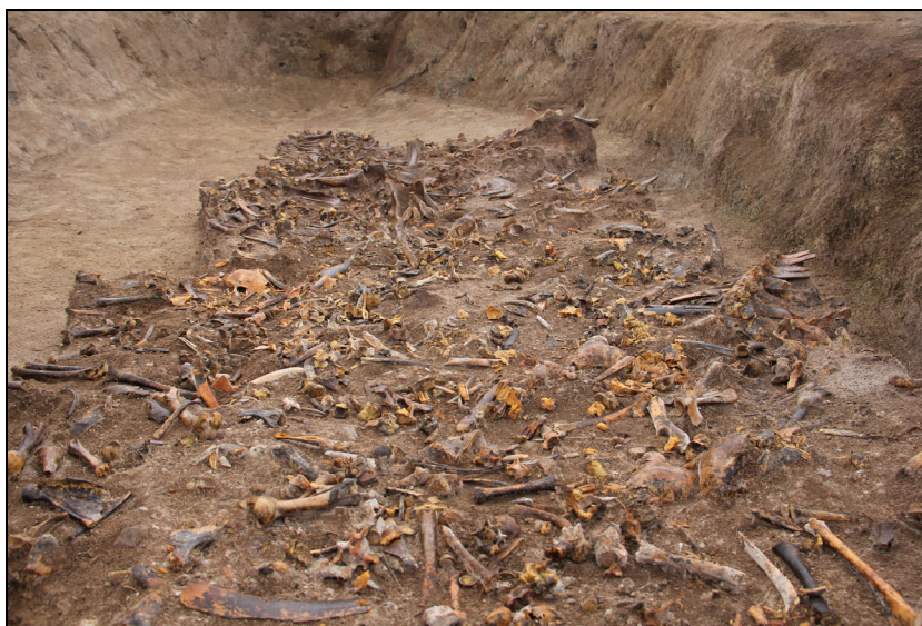
Рис. 3. Нижний слой костей животных в яме на поселении Абылай. Fig. 3. The lower layer of animal bones in the pit of the Abylai settlement.

ка А и, возможно, участка Б (рис. 2). Ее заполнение состояло из нескольких слоев. Верхний слой, мощностью 0,3 м, представлен относительно чистым грунтом материкового происхождения с небольшими зольными вкраплениями и единичными костями. Ниже залегал культурный слой, перемешанный с золой, с примесью костей, мощностью до 0,25 м. Нижний слой, мощностью около 0,4 м, состоял из золы с небольшой примесью культурного слоя и сильно насыщен костями животных (рис. 3). Из ямы извлечено около 6 тыс. костей животных, 90 % которых найдено в нижнем слое. Фрагментов керамики и каменных орудий в заполнении ямы не обнаружено. Позднее, когда о яме, вероятно, забыли, начался второй этап застройки, и на ее площади были сооружены постройки участка В (рис. 2).