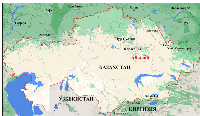
Рис. 1. Расположение археологического памятника Абылай. Fig. 1. Location of the archaeological site Abylai.

Поселение Абылай находится в Каркаралинском районе Карагандинской области Республики Казахстан (49°15' с.ш., 75°07' в.д.), на востоке Казахского мелкосопочника (рис. 1). Рельеф имеет ярусное строение: грядово-холмистый мелкосопочник со средними абсолютными высотами 450–700 м и межсочные равнины и широкие речные долины с абсолютными высотами 200–600 м [Кушев, 1969]. В настоящее время это подзона сухих степей с продолжительностью безморозного периода 115–170 дней, среднегодовой температурой 2,0–4,5 °С, средней температурой января 14,0–16,0 °С, средней температурой июля 21,0–23,0 °С и среднегодовым количеством осадков 220–250 мм. Климат резко континентальный, с резко выраженным летним максимумом осадков и почти полным их отсутствием в позднее зимне-весеннее время (февраль — май). Территория покрыта полынно-ковыльно-типчаковой растительностью [Федорович, 1969]. Среднегодовалая высота снежного покрова составляет 11–15 см, среднее число дней со снежным покровом — 147. Глубокий снежный покров, обледенение поверхности почвы, сильные ветра в сочетании с отрицательными температурами и метели создают неблагоприятные условия для выпаса животных. Количество малопригодных для выпаса скота дней составляет от 70 до 80 [Шварева, 1969]. В целом, территория благоприятна для пастбищного животноводства.