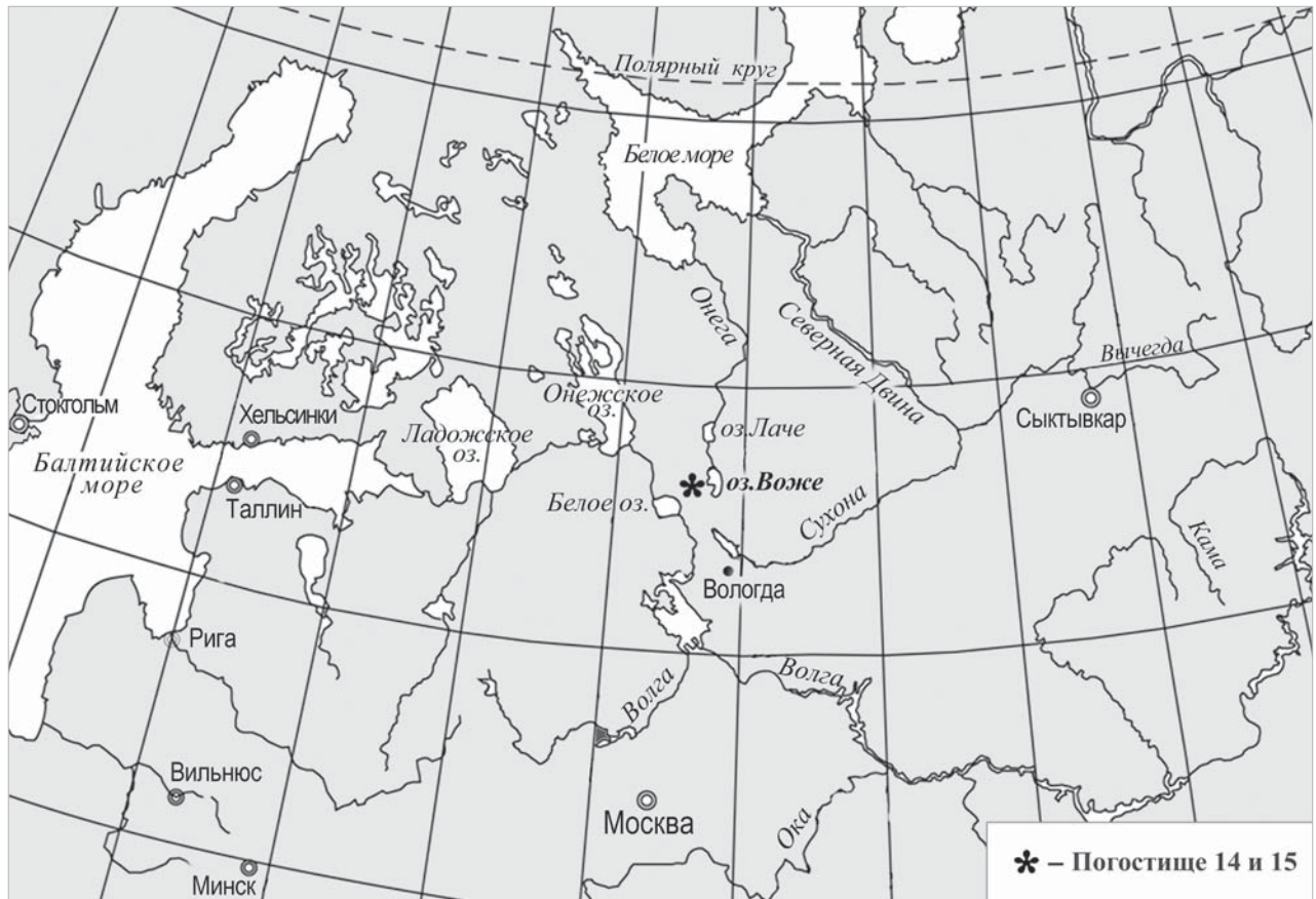
Карта расположения торфяниковых памятников Погостище 14 и 15

полевые исследования продолжаются, постоянно появляются новые материалы. В данной статье освещены все имеющиеся на настоящий момент свидетельства рыболовства по материалам раскопок на стоянке Погостище 14 за 2008–2010 гг. и на стоянке Погостище 15 за 2011–2019 гг.