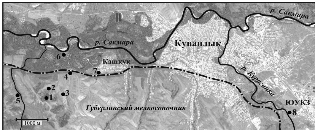
Рис. 1. Карта-схема района исследований в окрестностях г. Кувандык (Оренбургская обл.) и расположение обследованных биотопов: 1 — лесные колки на вершинах и склонах холмов (сопок); 2 — полосы кустарников на склонах холмов; 3 — участки степной растительности на склонах холмов; 4 — защитные лесополосы вдоль ж/д насыпи; 5 — заболоченная лесная пойма ручья; 6 — лесная пойма р. Сакмары; 7 — огороды, жилые и надворные строения в населенных пунктах (пос. Кашкук, г. Кувандык); 8 — загрязненная фторидами пойма р. Кураганка вблизи ЮУКЗ.

Fig. 1. Schematic map of the study area in the surroundings of the Kuvandyk town (the Orenburg region) and the locations of the examined biotopes: 1 — forest outliers on hill tops and slopes; 2 — bush belts on hill slopes; 3 — steppe vegetation spots on hill slopes; 4 — forest belts bordering the railway; 5 — woody swamp plain of a stream; 6 — woody floodplain of the River Sakmara; 7 — vegetable gardens, dwellings, and outbuildings in human settlements (the Kashkuk settlement, the Kuvandyk town); 8 — fluoride-contaminated floodplain of the River Kuraganka near the Southern Ural Cryolite Plant (SUCP).