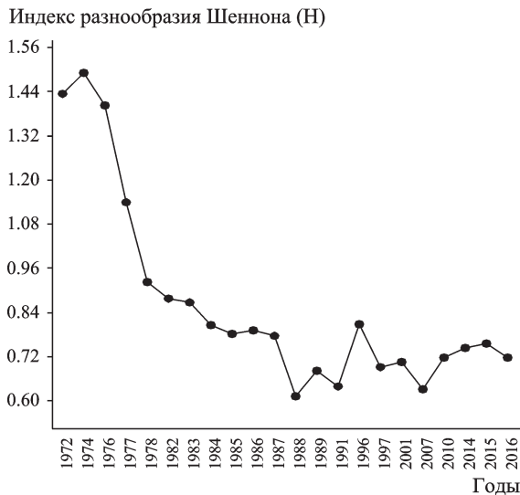
Рис. 2. Многолетняя динамика сглаженных методом скользящей средней значений индекса разнообразия Шеннона ( H ) в сообществе грызунов поймы р. Сакмары (окрестности г. Кувандык, Оренбургская обл.).

Сравнение также провели по трем последовательным аллохронным группам: А — начальный этап исследований в 1970-х гг.; Б — промежуточный временной этап 1980–1990-е гг.; В — современный этап 2001–2016 гг. Предварительный анализ с помощью теста