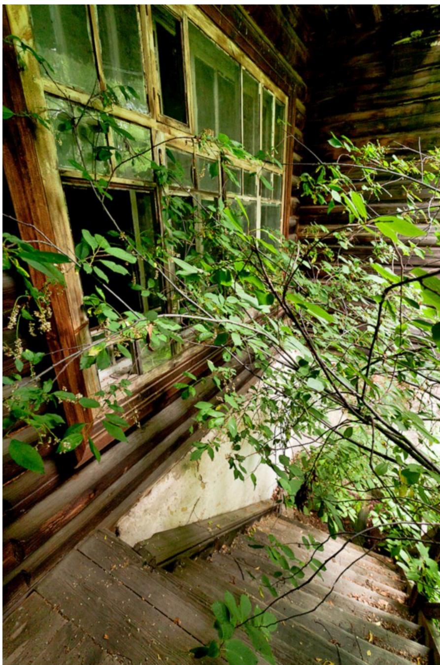
Деревья завоевывают новые территории.