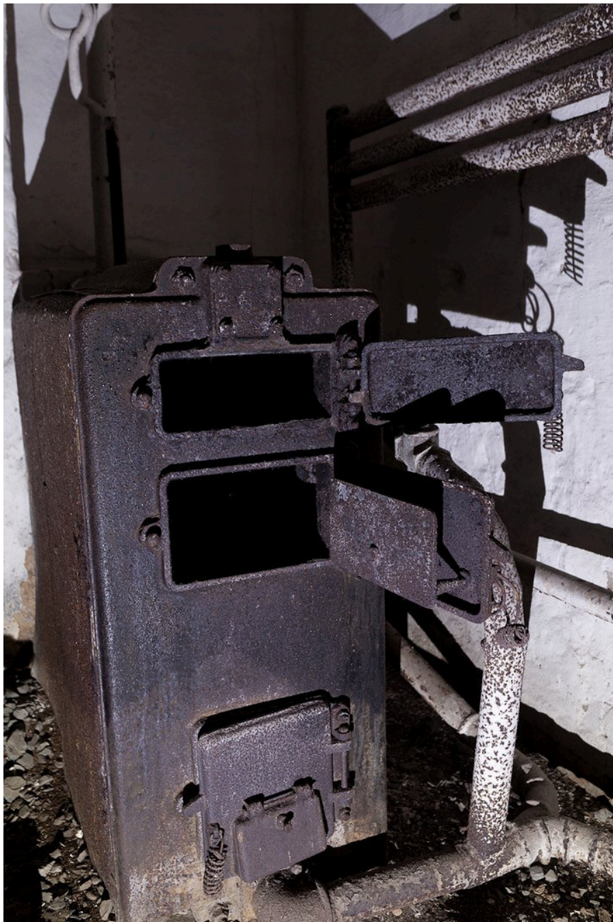
печь в подвале.