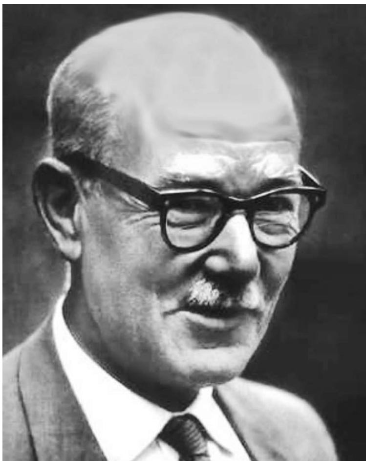
Академик В.В. Парин