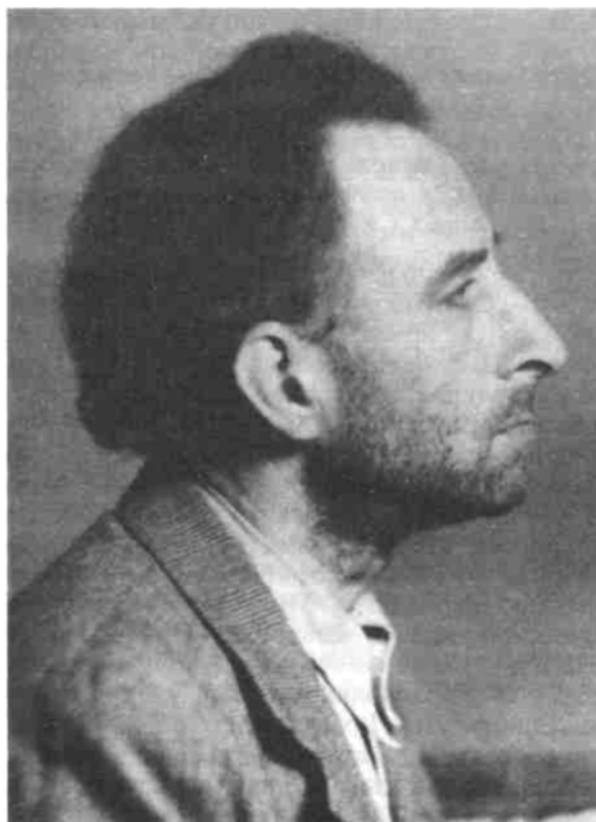
Узник Н.В. Тимофеев-Ресовский. Октябрь 1945 г.