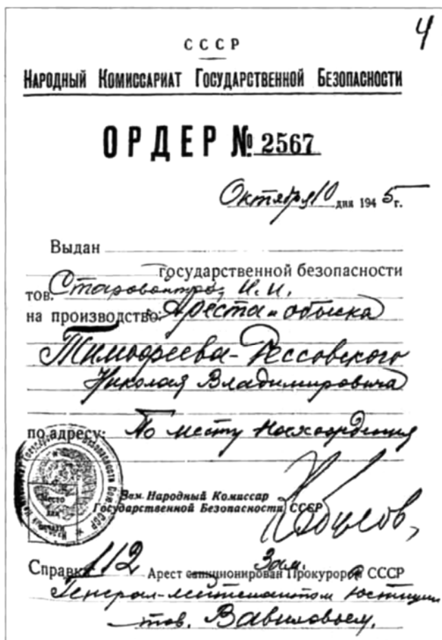
Ордер на арест и обыск Н.В. Тимофеева-Ресовского