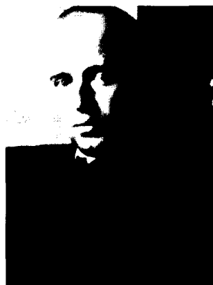
Фото 7. Ф.Г. Добжанский (1900–1975) 1