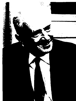
Фото 8. Ф.Г. Добжанский 1970-е гг. 2