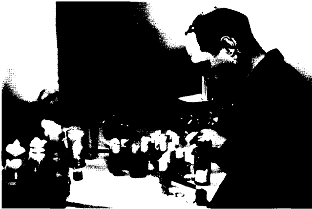
Фото 9. Г.Дж. Меллер (1890–1967). 1930-е гг.

этой же работе 1935 г. впервые был оценен размер гена как макромолекулы [см. также 10]. Мутация рассматривалась как качественный переход макромолекулы гена в новое состояние в результате непосредственного действия ионизирующего излучения на ген.