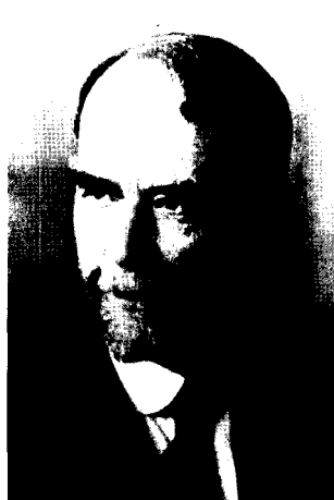
Фото 6. Т.Х. Морган (1866–1945)

Меллер опубликовал свое открытие в 1927 г. «Четыре страницы, которые взволновали ученый мир» — так назвал свой комментарий об этой работе в «Правде» 1 сентября 1927 г. А.С. Серебровский [6], сотрудник Н.К. Кольцова, основавший в 1930 г. кафедру генетики Московского университета. Меллер (после неудавшейся попытки самоубийства [20]) приехал в СССР через Германию, где он встретился с Н.В. Тимофеевым-Ресовским. По совету Тимофеева-Ресовского Меллер отправился в Институт генетики к Н.И. Вавилову и на кафедру генетики к Г.Д. Карпеченко, где он в дальнейшем преподавал генетический анализ дрозофилы. Эти лекции, как и многие другие, слушали вместе студенты обеих кафедр генетики Ленинградского университета. Лучшего специалиста по конструированию генетических линий дрозофилы в то время не существовало. Меллера можно назвать первым хро-