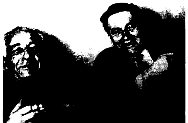
Фото 11. Н.В. Тимофеев-Ресовский (1900–1981) и М.Е. Лобашев (1907–1971) на кафедре генетики и селекции Ленинградского университета. 1960-е гг.

Позже, вскоре после возвращения с фронта (в 1946 г.) Лобашев защищает докторскую диссертацию, в которой формулирует физиологическую теорию мутационного процесса. Согласно этой теории мутация — не результат непосредственного изменения гена при попадании в него ионизирующей частицы или кванта энергии, а результат нетождественного восстановления — репарации клетки (генетического материала) после их повреждения [16]. Впервые в мировой науке М.Е. Лобашев поставил рядом два понятия: мутация и репарация. Мировая наука пришла к этому лишь в 60-е гг. XX в., и теперь связь репарации и мутационного процесса общепризнана [36]. Увы, это признание произошло уже без участия автора физиологической гипотезы. В наши дни механизмы возникновения мутаций связывают именно с многочисленными системами репарации ДНК в клетке. Справедливость требует напомнить, что М.Е. Лобашев говорил о денатурации