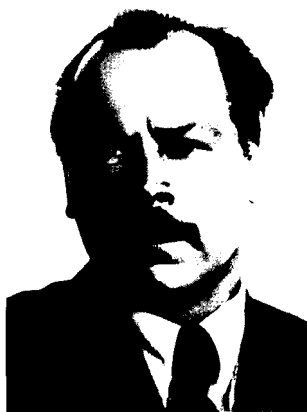
Фото 4. Н.И. Вавилов (1887–1943)