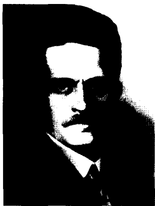
Фото 3. Ю.А. Филипченко (1882–1930)