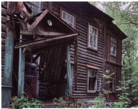
Биостанция сейчас.

Несмотря на то, что проводимые Николаем Тимофеевым-Ресовским исследования велись на территории Ильменского заповедника, в Объединенном государственном архиве Челябинской области сохранилось крайне мало материалов о его работе. Дело в том, что созданная им лаборатория находилась в подчинении Уральского филиала Академии