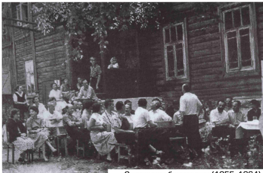
Сотрудники биостанции (1955–1964)