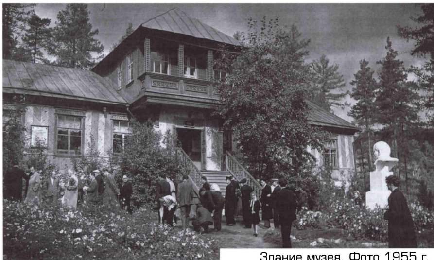
Здание музея. Фото 1955 г.