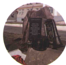
Мокшан и его вальс