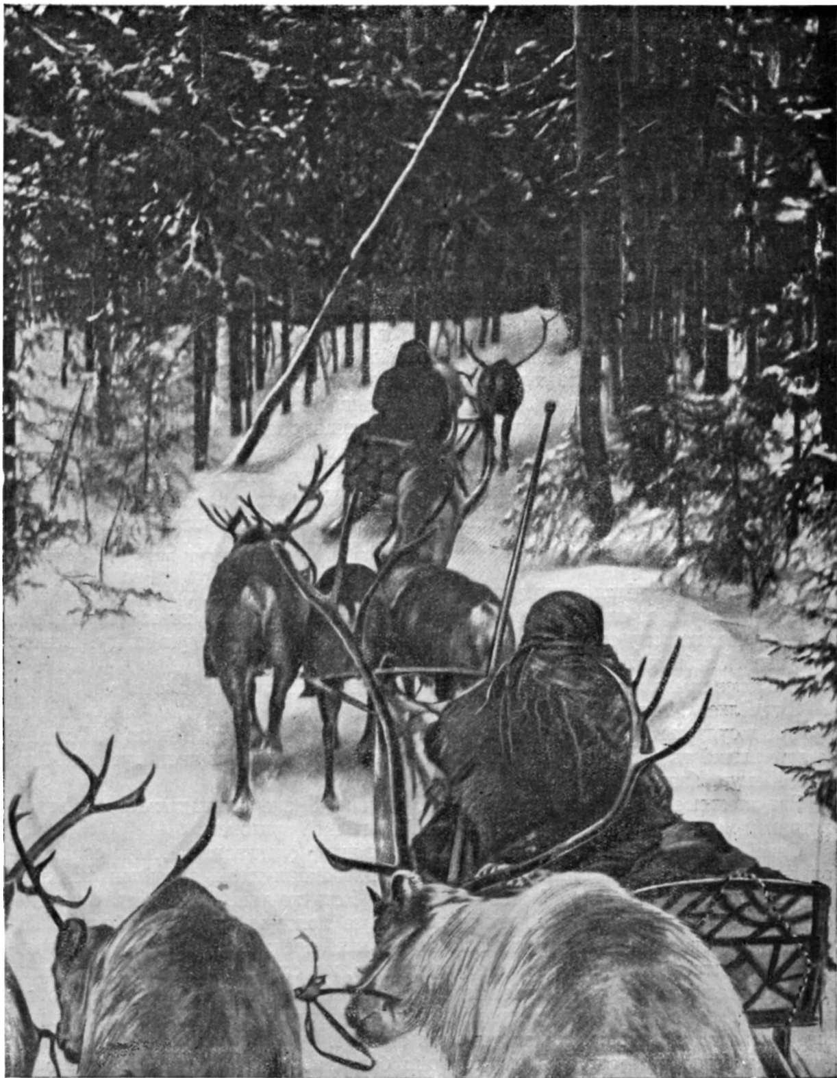
Оленьи упряжки в тайге