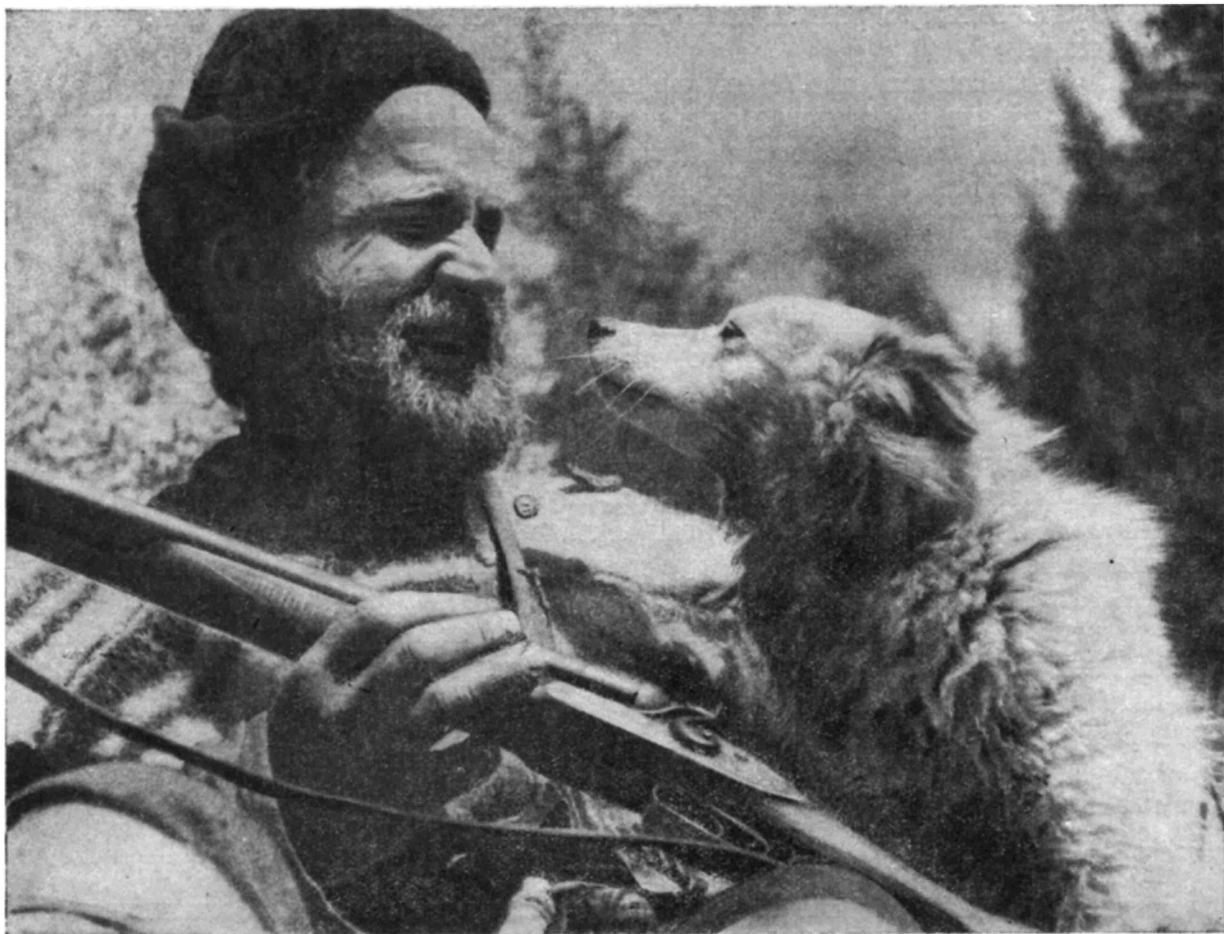
На севере Урала

Поэтому зимний выпас планируется таким образом, что стадо постепенно передвигается ближе к весенне-летним кочевьям, причём на конец зимы оставляют участки пастбищ с богатым запасом легко добываемых из-под снега кормов. Дальнейшие кочевья планируются с учётом выбора сухих мест в верхней части лесного пояса горных хребтов, наиболее удобных для отёла «важенок» и дальнейшего перехода оленей на высокогорные летние пастбища.