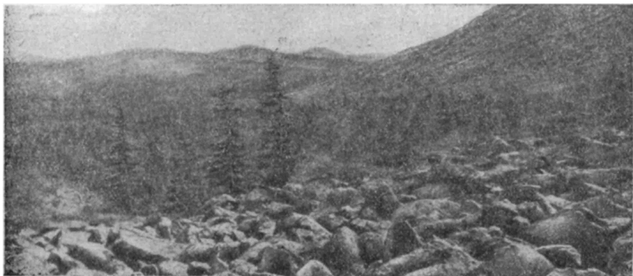
Верхняя граница лиственничного леса на контакте с каменной россыпью.

На территории Урала в течение всего года преобладают ветры западных, юго-западных и северо-западных румбов. Двигающиеся с запада атлантические воздушные массы, достигнув Уральского хребта и переваливая через него, охлаждаются с подъемом, что вызывает конденсацию атмосферной влаги. Поэтому западный склон Уральского хребта, по сравнению с прилегающими территориями, отличается повышенным количеством летних и зимних атмосферных осадков. Количество осадков закономерно возрастает по мере подъема в горы: с каждыми 100 м высоты мощность снегового покрова увеличивается в среднем на 17—18 см. Климатические особенности высокогорной области Урала благоприятствуют накоплению здесь мощных толщ снега.