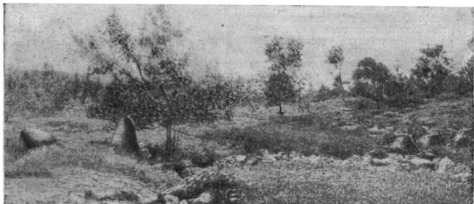
Низкорослое криволесье из извилистой березы.

В отличие от других притоков Волги, Кама является в основном рекой горного характера. Наиболее крупными реками левобережной части бассейна Камы являются: Вишера с притоками Колвой, Мойвой, Вёлсом, Улсом; Косьва с притоками Тылаем и Тыпылом; Чусовая с притоками Сулёмом, Межевой Уткой, Серебрянкой, Койвой, Усьвой; Белая с притоками Уфой (и впадающими в нее реками Ай, Юрюзань), Инзером, Нугушем. Истоки большинства этих рек или питающих их мелких речек (за исклю-