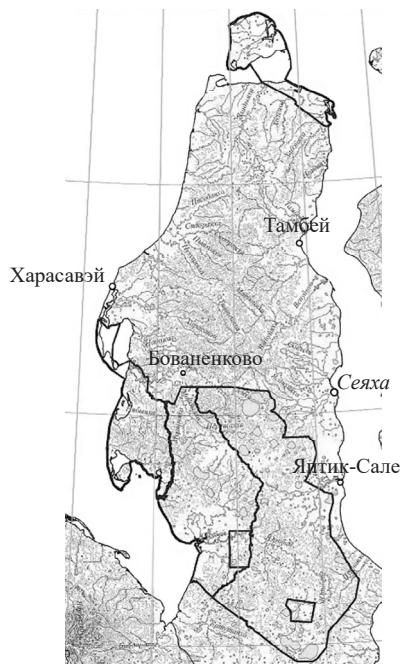
Рис. 1. Заказник «Ямальский»

Государственный природный заказник «Ямальский» изначально был создан в 1977 г. и позднее несколько раз реорганизовывался. В 2013 г. заказник утвержден в новых границах, в которых его общая площадь составила 4 113 686 га (рис. 1). Он состоит из двух участков — Южно-Ямальского и Северо-Ямальского. Основную часть заказника занимает южный участок — 3 702 415 га. Находится он в средней части полуострова Ямал и доходит до западного побережья — от северной части позоны кустарниковых тундр до самого юга арктических. В территорию заказника не входят лицензионные участки «Усть-Юрибейский», «Мало-Ямальский», а также полоса землеотвода железнодорожной линии Обская — Бованенково. Северо-Ямальский участок занимает 411 270 га крайнего северо-востока полуострова Ямал и о. Белый.