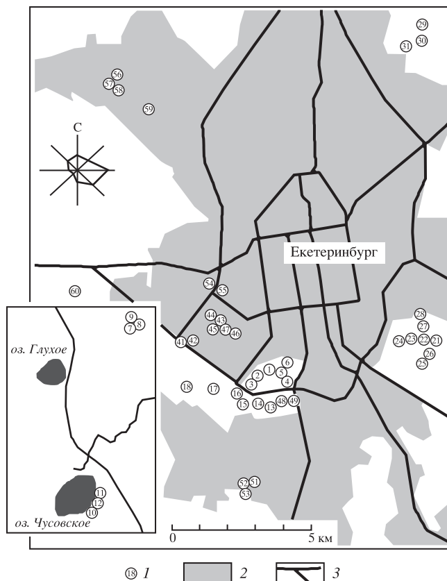
Рис. 1. Роза ветров и схема расположения пробных площадей (1) в зоне городской застройки Екатеринбурга (2), в лесопарках и окрестностях города относительно основных транспортных магистралей (3). Загородный участок в районе оз. Глухое и Чусовское (врезка) расположен в 8–10 км на запад от границы городской застройки.

В качестве характеристик уровня антропогенной нагрузки использовали: а) расстояние от центра города до пробной площади; б) расстояние от границы городской застройки до пробной площади; в) плотность населения вблизи пробной пло-