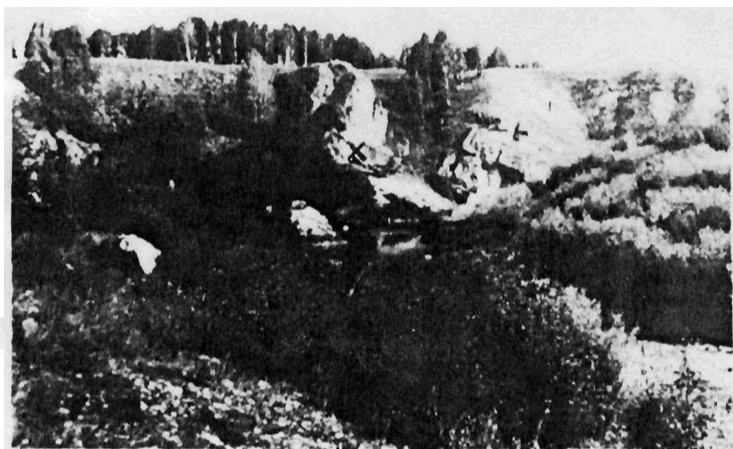
Вид на скалы, в которых находится грот Зотинский; крестом обозначен вход в грот.

В гроте Зотинском в верхней части отложений обнаружены фрагменты керамики, 2 костяных наконечника стрел и кости человека. Эти остатки представляют собой разрушенное погребение и датируются ранним железным веком. В нижележащих слоях найдены 6 каменных изделий и кости волка, песца, пещерного медведя, сайги, северного оленя, первобытного бизона, лошади, шерстистого носорога,