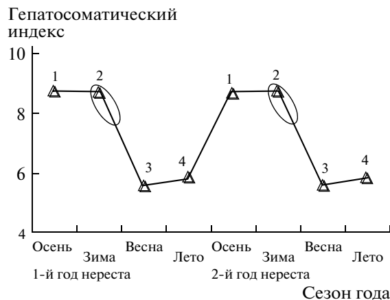
Рис. 2. Изменение величины гепатосоматического индекса самцов, нерестящихся ежегодно.

Теоретически можно предположить, что у особей с отклонениями гепатосоматический индекс должен быть меньше. Для проверки этой гипотезы