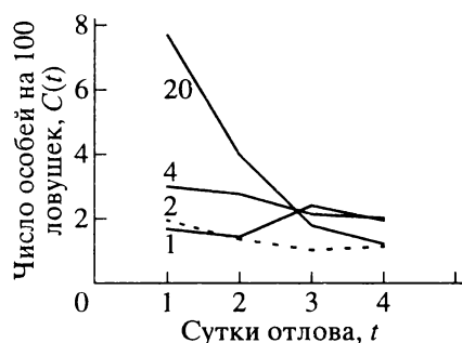
Рис. 1. Характер кривых вылова рыжей полевки из местообитаний, расположенных на разном удалении (1, 2, 4 и 20 км) от источника техногенной эмиссии. Средний Урал, СУМЗ. Усредненные данные за 1990–1994 гг.

Количественный анализ подтвердил высказанные предположения (табл. 3). В градиенте техногенных факторов по мере изменения степени деградации местообитаний наблюдались устойчивые изменения следующих характеристик рыжей полевки: обилия оседлых и мигрирующих особей, общего обилия животных и доли мигран-